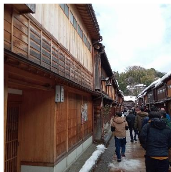
2日間の旅を終え 金沢駅へ 帰路につく