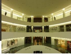
加賀 山代温泉 ゆのくに天祥 泊